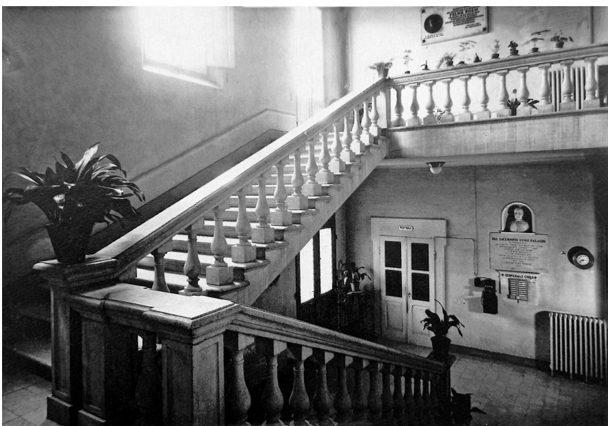
Fig. 2. Scalone di accesso al primo piano dell'Ospedale