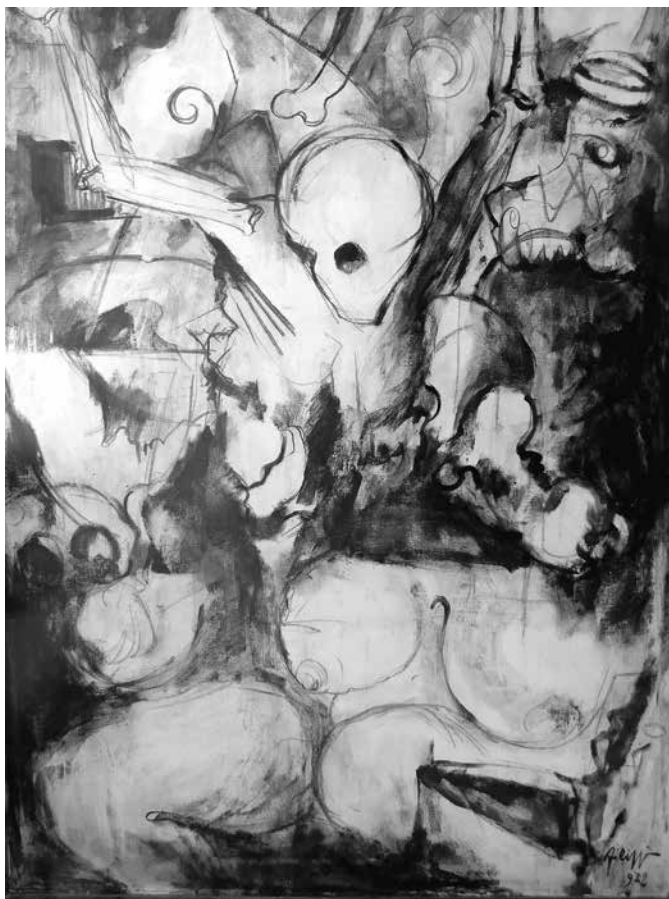
Fig. 9 - Crocefissione , 1972 Olio su tela, 150x100 cm

apprezzare le sue scene marine. Sono scene di spiaggia per lo più con i bagnanti distesi sulla sabbia ( fig. 11 ).