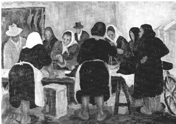
Fig. 1 - Le pescivendole , s.d. Olio su tela, 80x100 cm

In questa direzione è da vedere anche un paesaggio urbano non a caso intitolato Tra vecchio e nuovo , del 1958 (fig. 2). Da non ammirare come un paesaggio qualsiasi, ma come una testimonianza del pittore che si guarda attorno e vede il proprio paese inesorabilmente modificarsi dopo le ferite causate dalla guerra, aggredito dalla insorgente speculazione edilizia. Il titolo allude evidentemente alla vecchia città che scompare per lasciare il posto a chissà quale grattacielo o condominio.