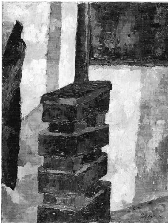
Fig. 4 - La stufa Becchi , 1959 Olio su tela, 80x60 cm

La scuola, dicevo, è una delle fonti d'ispirazione per il pittore che anche negli anni Sessanta persiste sulla linea della pittura di realtà, ma sempre più, a mano a mano che gli anni passano, colorata di sentimento. Filippi dipinge innumerevoli ritratti di scolari, è attratto dalla grazia e dalla spensieratezza dei volti giovanili.