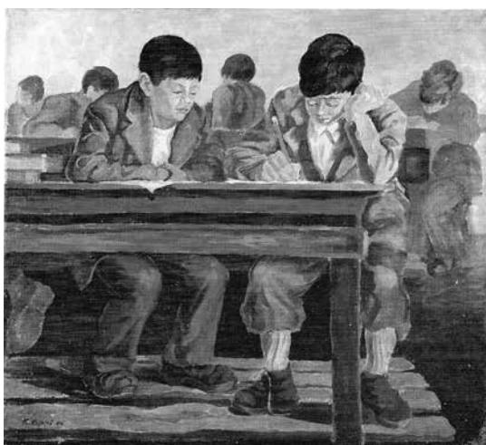
Fig. 3 - La scuola , 1956 Olio su tela, 90x100 cm

Ma il sociale per Filippi è certamente rappresentato dal suo mondo quotidiano, cioè la scuola, fonte d'ispirazione inesauribile; e tale sarà fino al suo ultimo giorno trascorso in aula. Uno dei suoi primi dipinti tra i tanti intitolati La scuola risale al 1956 (fig. 3).