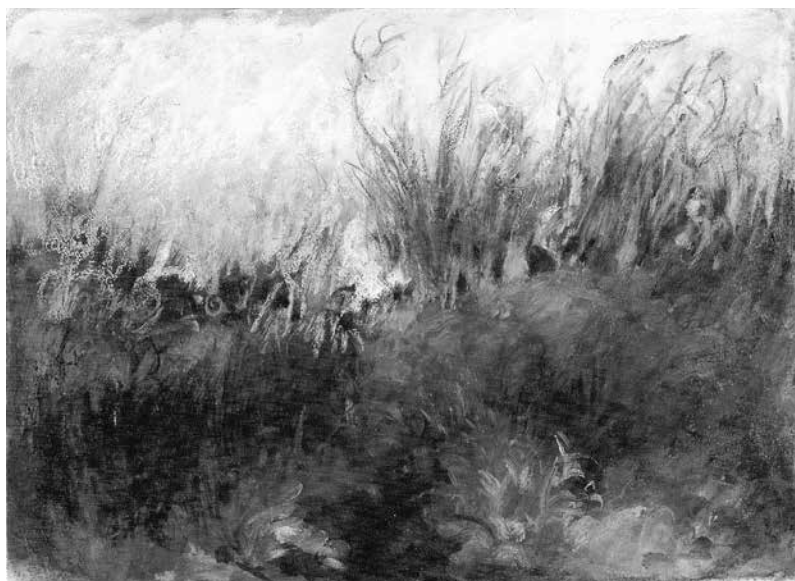
Fig. 13 - Paesaggio , s.d. Olio su cartoncino telato, 55x75 cm