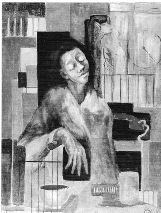
Fig. 7 - Figura e ambiente con telefono rosso , 1969 Olio su tela, 120x90

Insisterei semmai sul fatto che tali composizioni segnico-cromatiche vanno viste come manifestazioni di una memoria della diretta esperienza di lotta partigiana che in Filippi non si è mai spenta, ma anche come atti di denuncia forte e di condanna degli orrori della guerra, quella passata e quelle in corso in varie parti del mondo, tant'è che egli dedica alcune delle sue immagini proprio ai fatti del Vietnam. E si vede, inoltre, come nell'affrontare questa tematica, il "Filippi maturo" usi due linguaggi espressivi, uno sostanzialmente figurativo e l'altro basato sulla rottura dell'immagine con il recupero di stilemi postcubisti e in chiave metaforico-simbolista. È in ogni caso in opere come queste, così cariche al tempo stesso di ragioni intime e di significati sul piano sociale, che Cesare Filippi sembra voler determinare una sorta di interferenza attiva fra ciò che realisticamente è all'origine del proprio racconto visivo e ciò che risulta ed appare all'occhio dello spettatore.