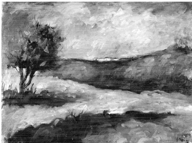
Fig. 12 - Paesaggio , 1992 Olio su cartone telato, 55x75 cm