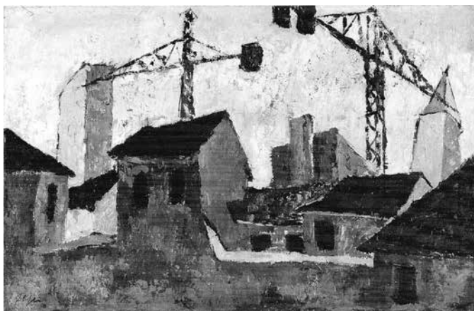
Fig. 2 - Tra vecchio e nuovo , 1958 Olio su tela, 90x100 cm

In questa direzione è da vedere anche un paesaggio urbano non a caso intitolato Tra vecchio e nuovo , del 1958 (fig. 2). Da non ammirare come un paesaggio qualsiasi, ma come una testimonianza del pittore che si guarda attorno e vede il proprio paese inesorabilmente modificarsi dopo le ferite causate dalla guerra, aggredito dalla insorgente speculazione edilizia. Il titolo allude evidentemente alla vecchia città che scompare per lasciare il posto a chissà quale grattacielo o condominio.