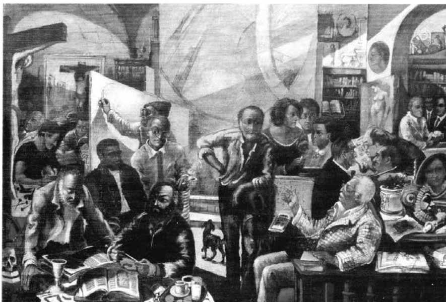
Fig. 6 - La bottega dell'antiquario , 1980 ca Olio su tela, 200x300 cm

è anche questo un segno che l'iniziale impronta realista si è a poco a poco sciolta in chiave metaforica come ha scritto qualcuno, ma specialmente, a mio avviso, con una risoluzione lirica, sentimentale, patetica. E tutto questo dopo un passaggio nella sfera esistenziale ed intimista durante gli anni Sessanta, come ha giustamente osservato il critico bolognese Marcello Azzolini.