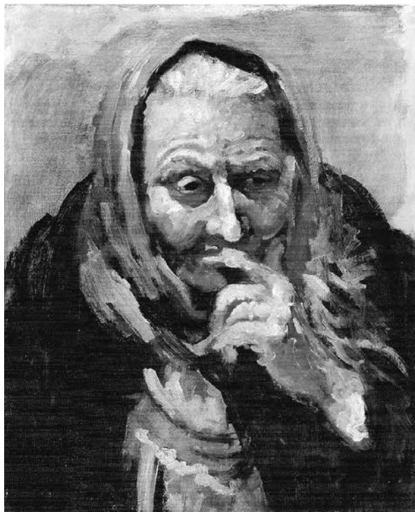
Fig. 10 - Ritratto di mia madre , s.d. Olio su tela, 50x40 cm