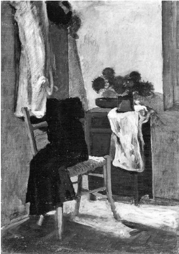
Fig. 14 - Interno con fiori secchi , s.d Olio su tela, 100x70 cm

Nel continuo mutare e sovrapporsi dei soggetti, dell’“ultimo Filippi” meritano un cenno gli “interni” ( fig. 14 ), specialmente quelli dipinti negli anni Novanta, nei quali riaffiora l’iniziale matrice figurativa, e le nature morte, come quelle ammirate qui a Forlimpopoli per l’edizione dei “Mangiari dipinti” nel 2009, cioè un anno prima della scomparsa dell’artista.