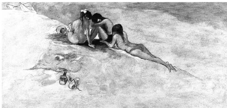
Fig. 11 - Bambini al mare , 1997 Olio su tela, 100x180 cm