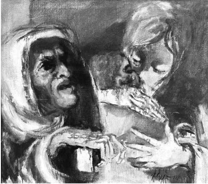
Fig. 8 - No alla violenza , 1972 Olio su tela, 90x80 - Forlimpopoli, Raccolta Comunale d'Arte

Di memoria resistenziale sono anche diverse opere pittoriche, dal Bambino deportato databile ai primi anni Cinquanta, alla tragica figura di Partigiano torturato del 1962, alla drammatica scena familiare del dipinto datato 1972, che fa parte della Raccolta Comunale d'Arte di Forlimpopoli (fig. 8), alla grande Crocefissione (fig. 9), che per la sua costruzione rimanda direttamente alla serie grafica esposta nella mostra.