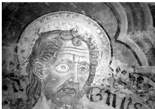
Madonna col Bambino e San Giovanni Battista, particolare del volto di San Giovanni Battista, Meldola, oratorio di San Giovanni

Altro esemplare di polittico affrescato presente nel territorio forlivese e per certo assimilabile ai precedenti è quello conservato a Forlì.