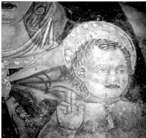
Madonna col Bambino e San Giovanni Battista, particolare del Bambin Gesù, Meldola, oratorio di San Giovanni

Il pannello a sinistra è occupato dalla rappresentazione di San Giovanni Battista Precursore, nell'atto di indicare il Redentore in braccio alla Vergine. Il santo è raffigurato con il volto magro ed emaciato, solcato da rughe profonde sulla fronte e intorno alla bocca, dai lineamenti pesantemente marcati e tratteggiati con continue linee scure. San Giovanni è vestito con una tunica di pelli – resa con tratti sinuosi nelle tonalità che variano dal rosso, al marrone, all'ocra – fermata alla cintola con un nodo elaborato che ingentilisce l'immagine; allo stesso modo, il mantello porpora e bianco è buttato quasi distrattamente sulla spalla del santo.