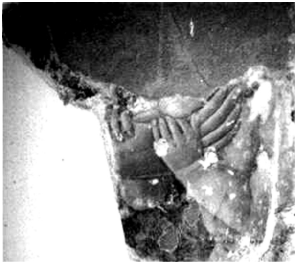
Madonna col Bambino , particolare delle mani della Vergine e del Bambino, Forlimpopoli, chiesa di San Pietro apostolo