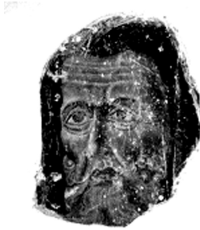
Volto di santo eremita, Forlimpopoli, chiesa di San Pietro apostolo

Per questi motivi è ipotizzabile che dovesse trattarsi della raffigurazione di un santo eremita o monaco, quale Sant'Antonio Abate, anche se si ritiene azzardato tentare di attribuirgli un nome sicuro.