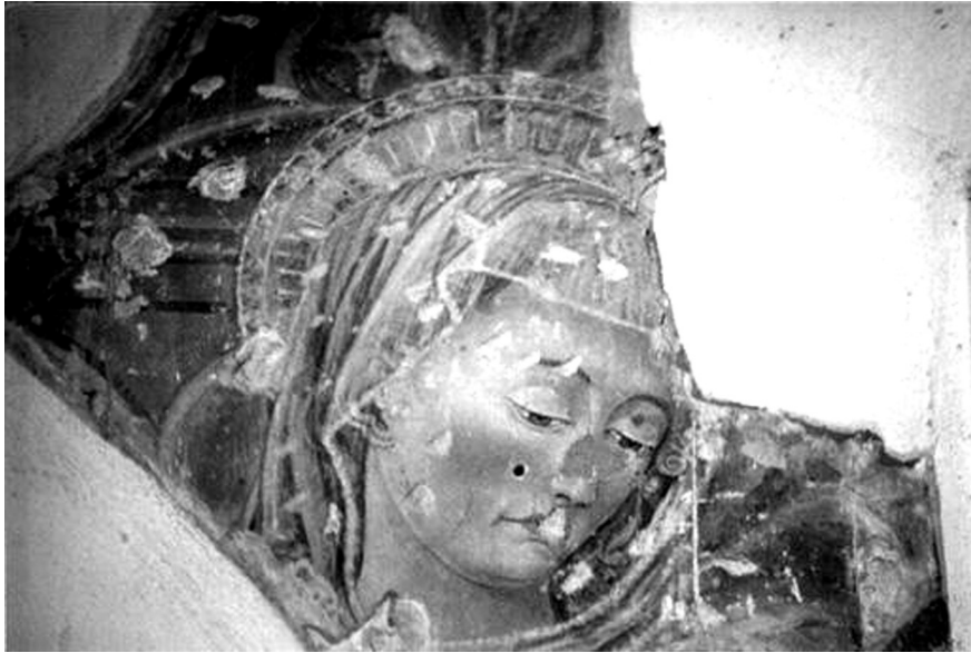
Madonna col Bambino , particolare del volto della Vergine, Forlimpopoli, chiesa di San Pietro apostolo