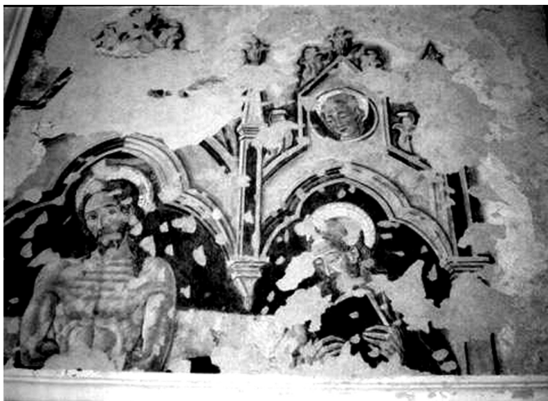
Cristo alla colonna e santi, Forlì, Chiesa della Ss. Trinità

L'opera si data alla seconda metà del xv secolo quando in regione dominava e persisteva una cultura artistica di matrice gotica ma cominciarono a diffondersi nuove idee e nuove forme proprie della civiltà rinascimentale. Questo polittico riunisce in sé tratti della vecchia e della nuova 'poetica': nella struttura compositiva dell'affresco così come della rappresentazione dei personaggi.