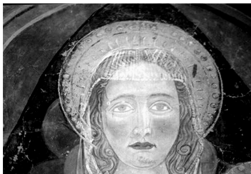
Madonna col Bambino e San Giovanni Battista, particolare del volto della Madonna, Meldola, oratorio di San Giovanni