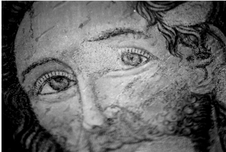
Cristo alla colonna e santi , particolare del volto di Cristo, Forlì, chiesa della Ss. Trinità

Lo scomparto di destra è occupato invece da una figura di santo il quale è rappresentato immerso nella lettura di un libro che egli trattiene tra le mani: unico dato utile per l'eventuale sua identificazione,.