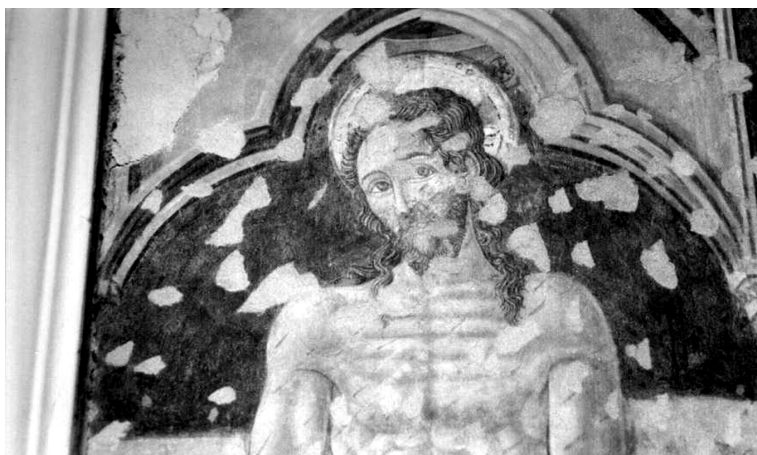
Cristo alla colonna e santi , particolare di Cristo flagellato, Forlì, chiesa della Ss. Trinità

Lo scomparto centrale è quello che occupa la posizione più rilevante nell'intera impostazione dell'opera e raffigura Cristo flagellato – di cui si conserva solo la parte superiore del corpo, le mani legate dietro alla schiena – alla colonna di cui si intravede solamente un dettaglio del capitello. La figura è rappresentata frontalmente, la testa leggermente reclinata da un lato, gli occhi spalancati verso l'alto con uno sguardo che «prefigura il tema della resurrezione ed allude alla dimensione profetica dell'avvenimento» 14 .