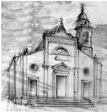
M. Di Cicco, Chiesa di San Pietro apostolo in Forlimpopoli

Il nome, tuttavia, sembra che possa aderire in maniera abbastanza calzante alle caratteristiche di questo pittore e richiamare alla mente le maggiori opere da lui realizzate.