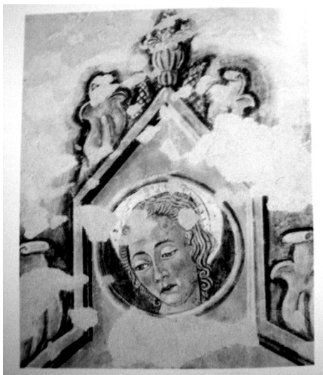
Cristo alla colonna e santi, particolare della cuspide, Forlì, chiesa della Ss. Trinità