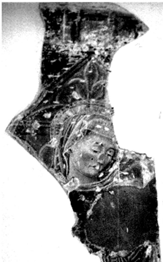
Madonna col Bambino, Forlimpopoli, chiesa di San Pietro apostolo