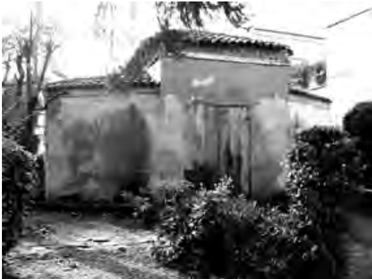
Fig. 8 - «Caffeaus»: prospetto anteriore in leggero scorcio