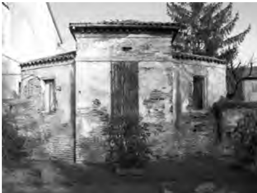
Fig. 2 - «Caffeaus»: prospetto posteriore (visione da via Circonvallazione)