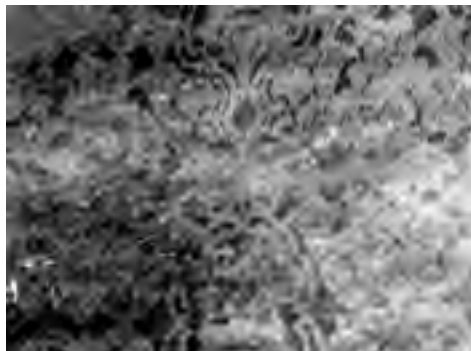
Fig. 19 - Interno della «caffeaus»: intreccio vegetale