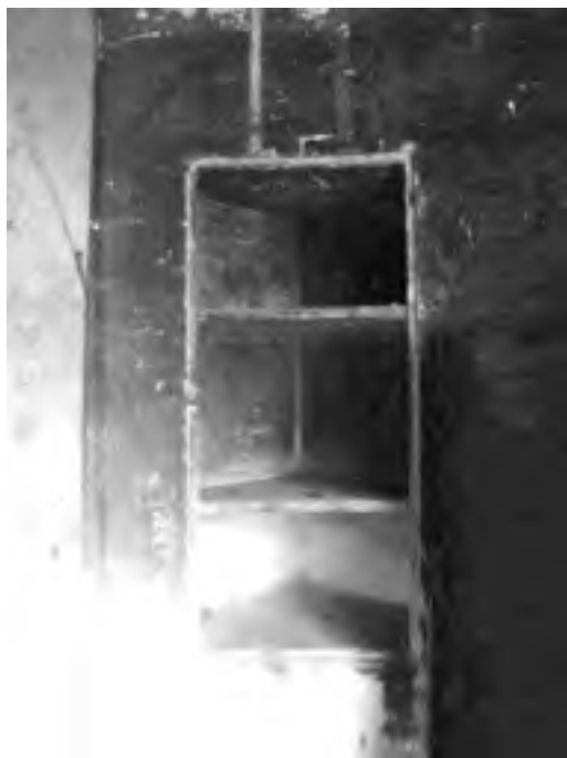
Fig. 10 - Interno della «caffeaus»: uno dei due contenitori in legno murati nella parete

Ancora negli anni Cinquanta o inizio Sessanta del medesimo secolo, invece, sempre facendo riferimento alle notizie raccolte dal ricordato Mariani, si poteva ancora distintamente osservare nel manufatto, tenuto relativamente sgombro e pulito, soltanto accogliente due contenitori in legno con ripiani per suppellettili incastonati nei muri a fianco del finestrone centrale (tuttora esistenti ed integri) (fig. 10), una condizione ben diversa: nel soffitto, infatti, volta emisferica cilindrica ribassata in appoggio e raccordo alla parete interna dell'ambiente centrale, anch'essa curiosamente cilindrica e pure su questa medesima - soluzione non in progetto forse quindi decisa in corso d'opera - appariva una serie di particolari configurazioni decorative, presumibilmente coeve agli anni d'innalzamento dell'edificio stesso (ma non va escluso in assoluto la posteriorità di alcune parti), interessanti benchè realizzazioni certamente esito di un assai modesto ornatista - ammessa questa la sua professione e non altra minore - anch'egli tutt'oggi in ogni modo risultante ignoto.