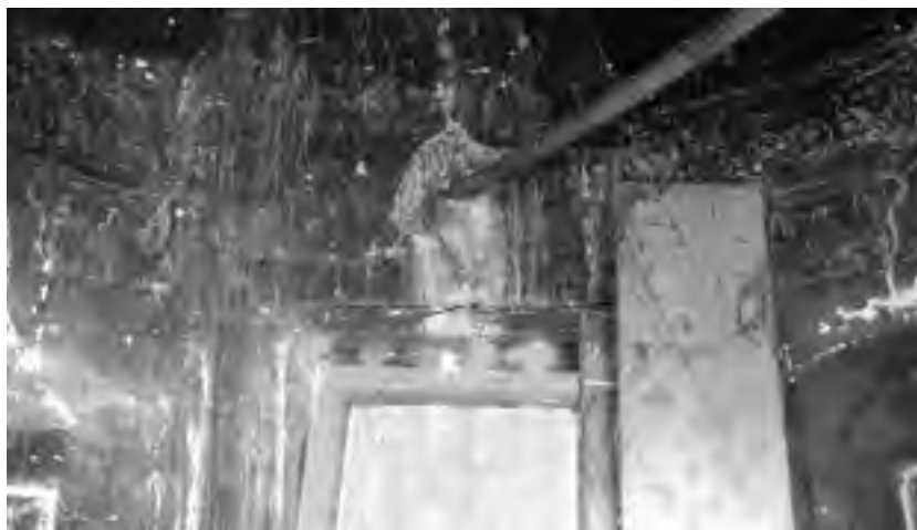
Fig. 14 - Interno della «caffeaus»: parete muraria con a sinistra e a destra lesene e capitelli