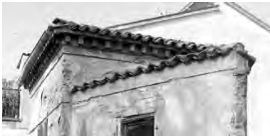
Fig. 6 - «Caffeaus»: particolare della modanatura e della fascia in aggetto

Con singolarità però, il prospetto che più sembra interessare l'osservatore contemporaneo che abbia la possibilità di guardare il manufatto anche dall'interno del giardino e perciò di comparare, appare, piuttosto che l'anteriore rivolto alla casa del proprietario (il fronte principale), il posteriore in affaccio sulla strada. Il motivo è semplice: quest'ultimo, essendo visto da quota più bassa, risulta più slanciato, meno monotono, maggiormente ornato dal tratto scoperto e ben conservato di muro civico - quello di destra - con i peculiari elementi, ovvero il brano di «sperone» restante e le caditoie, oltreché dalle finestre - esistenti solo in questa parte della «caffeaus» - a fronte dell'unica presenza, sulla facciata alzata verso la casa, della sola porta d'entrata, perfino più bassa del finestrone sul panorama collinare (figg. 7, 8, 9); non v'è dubbio, tuttavia, che all'epoca della realizzazione il fronte anteriore, seppur più elementare, rivolto alla casa, in visione, appunto, da questa sulla fine del vialetto come scena di fondo del giardino - configurato, come s'è detto, da alcuni tipici per quanto minimi componenti d'apparato di villa e in qualche esigua misura ispirato all'impianto paesistico/romantico all'inglese - figurati in tutt'altro modo da oggi (tra l'altro nel corpo centrale non vi sono più le mensole della modanatura) e quindi decisamente, ad inizio Ottocento, lo si apprezzò come o anche più del prospetto sulla strada.