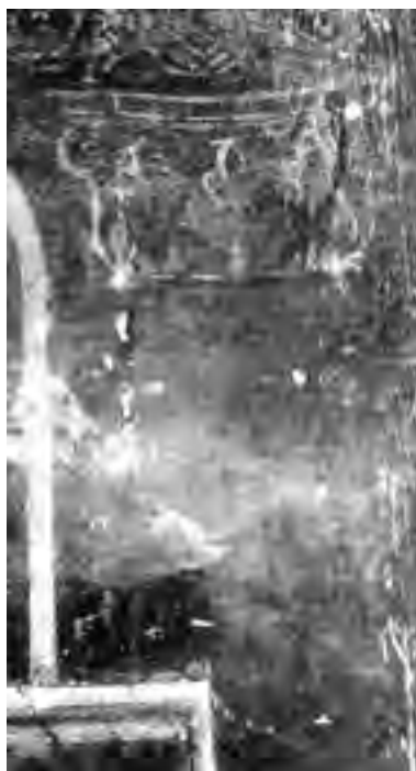
Fig. 15 - Interno della «caffeaus»: parete muraria, singola lesena con capitello