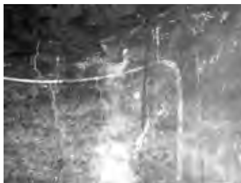
Fig. 17 - Interno della «caffeaus»: particolare di riquadro stonato negli angoli