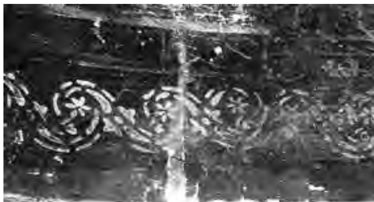
Fig. 18 - Interno della «caffeaus»: girale fitofloresale