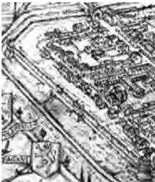
Fig. 1 - Particolare dal disegno novaghiano raffigurante «Forlimpopoli nel sec. XVII», in Forlimpopoli nel 600° della ricostruzione, 1300 - 1980 , Forlimpopoli 1983, nel quale appare la costruzione in esame

primottocentesca alla quale s'è accennato di relativa, facile acquisizione di talune aree comunali - nello specifico di parti del terraglio - per diretta occupazione in qualche modo stabilizzata nel tempo o per regolare concessione municipale, ed alla possibilità di alzare talvolta su queste manufatti edilizi di varia natura: aspetto un po' sorprendente e contraddittorio 12 , perché, anche al di là delle preesistenti, antiche leggi statutarie ancora vigenti in quegli anni, si sa che i governi locali (il frangente storico, qui, è il Regno d'Italia dal 1805 con Napoleone re, e l'ambito amministrativo è Forlì capoluogo compreso in una «prefettura») in fatto di interventi sulla cosa pubblica riconducibili al territorio ed alla città - come del resto, poi, anche ad altri settori - sono pressati non poco dall'Autorità centrale francese perché adottino ed applichino le precise e rigide normative, spesso restrittive o comunque volte ad attento controllo degli interessi dell'Istituzione, da essa indicate 13 .