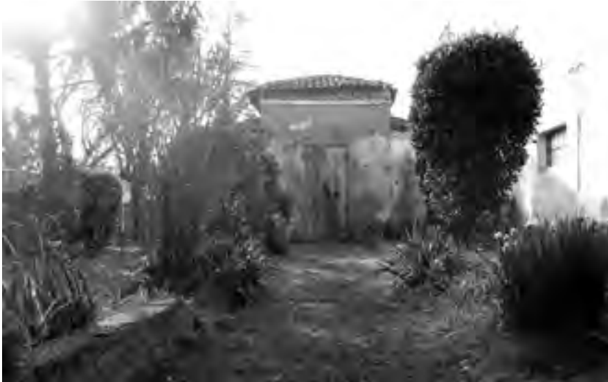
Fig. 7 - «Caffeaus»: prospetto anteriore, rivolto sul giardino della casa (visione parziale), nella contemporaneità molto impoverito ed in parte strutturalmente modificato