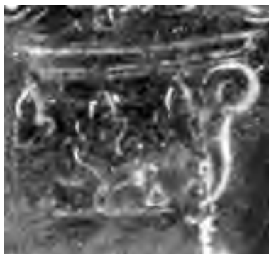
Fig. 16 - Interno della «caffeaus»: parete muraria, solo capitello