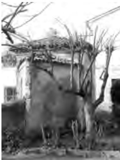
Fig. 9 - «Caffeaus»: fianco

In ogni caso, di questa piccola «caffeaus» sono tuttavia gli ambienti interni, dei quali le immagini oltretutto anch'esse necessariamente in bianco e nero che si proporranno ne riveleranno più che altro la grave situazione, e non il suo insieme murario esterno copertura inclusa, ad apparire nella contemporaneità ancor più offesi, e certamente - stando al tipo di danni presenti (soffitti di canniccio e malta di gesso sfondati nelle due ali, spessa e nera fuliggine, colature e sporcizia coprenti ovunque) - più che dal peso dell'età o solo da ciò, di certo soprattutto dalla totale incuria riservata al fabbricato dai proprietari succedutisi nel tempo 31 : specialmente quella negligenza generatasi da un certo periodo del xx secolo (anni Settanta?) in avanti, ovvero quando alcuni possessori - se si vuole escludere un principio d'incendio generato da una qualche causa non necessariamente dolosa - accendono insensatamente, all'interno dell'edificio, un focolare privo di canalizzazione di convogliamento del fumo, soltanto forse contando sul suo smaltimento attraverso le finestre