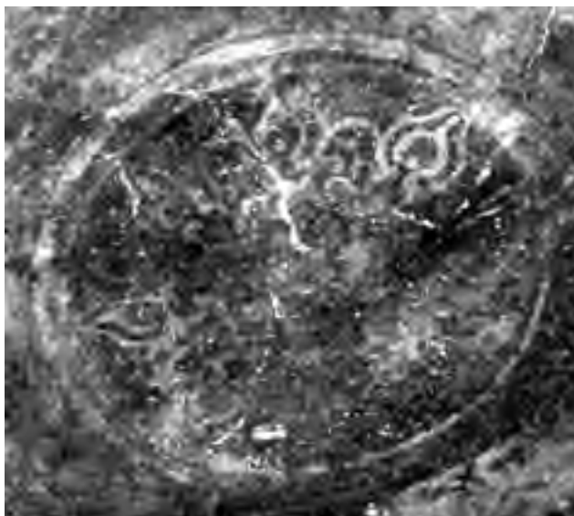
Fig. 12 - Interno della «caffeaus»: motivo centrale compreso nella volta