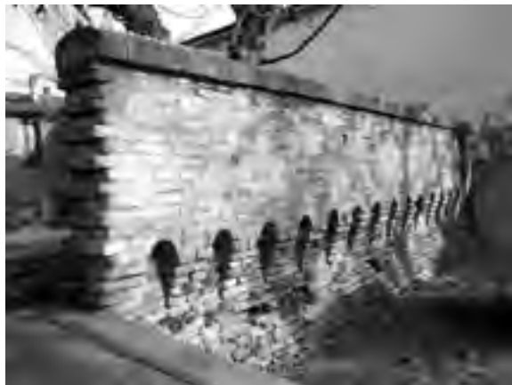
Fig. 4 - «Caffeaus»: tratto di muro difensivo con ben evidenti le caditoie e la loro attuale altezza dal suolo

Con copertura a padiglione nella parte centrale e due brevi falde nelle laterali, il fabbricato - del quale resta sconosciuto il capomastro costruttore - si presenta strutturato in piena simmetria, eretto per metà sul muro e per metà sul terraglio come indicato nel disegno (la visione dell'intera base rivolta alla strada, s'è appena detto, è nascosta dal riporto di terra) (fig. 5), e con aree parietali intonacate, all'epoca color arancio come rivelano esigui lacerti probabilmente originali sopravvissuti in alcune parti meno colpite dalle intemperie di due secoli 30 .