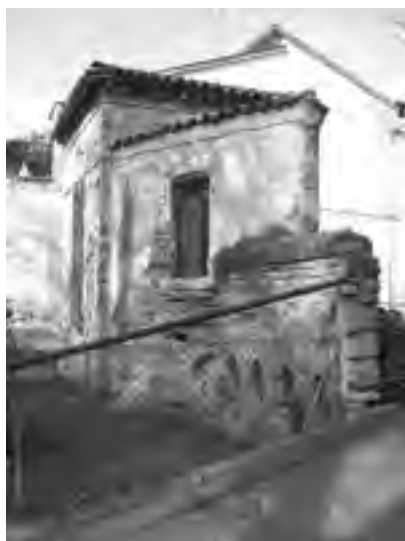
Fig. 3 - «Caffeaus»: prospetto posteriore in forte scorcio; si vedono quattro caditoie nel brano murale e la loro attuale altezza dal suolo