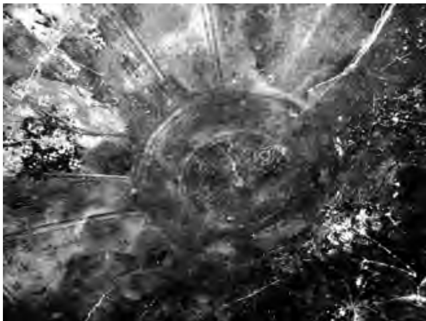
Fig. 11 - Interno della «caffeaus»: volta