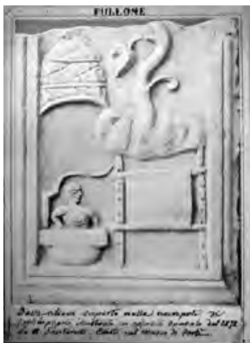
Fig. 1 - Fullone