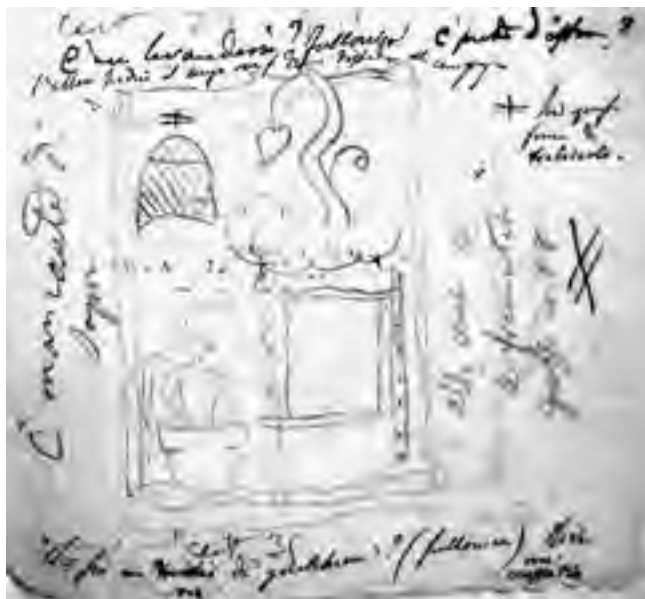
Fig. 7 - Disegno di Santarelli dell'insegna di fullonica (BCFO, Fondo Santarelli, b. 2, f. 1)

e una foglia stilizzata. Dall'altura si diparte una sorta di cordone quasi a simulare una canalizzazione/conduittura idrica che, scendendo dalla collina, va a rifornire la grande vasca. Conclude la 'narrazione', in alto a sinistra, un oggetto a forma di 'capanna' caratterizzato da un 'intreccio' di linee orizzontali e oblique.