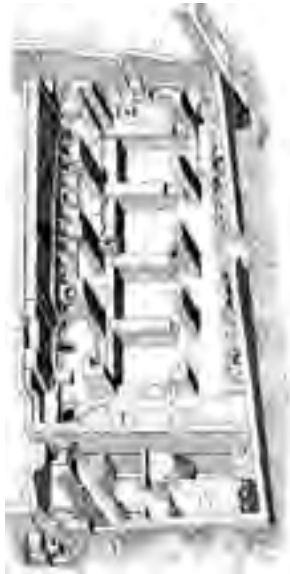
Fig. 12 - Planimetria con alzati della fullonica di Ostia lungo la via degli Augustali (v,vii,3) (da: PIETROGRANDE, cit., 1976, fig. 20)

Altre fulloniche sono state rinvenute durante gli scavi di Ostia antica: le officine, in numero di sei e di diverse dimensioni, sono tutte ascrivibili a un periodo compreso fra I e II secolo d.C. 59