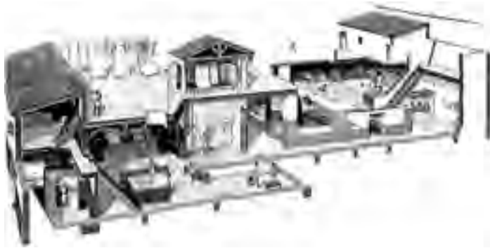
Fig. 11 - Ricostruzione assonometrica della fullonica di Stephanus a Pompei

Altre fulloniche sono state rinvenute durante gli scavi di Ostia antica: le officine, in numero di sei e di diverse dimensioni, sono tutte ascrivibili a un periodo compreso fra I e II secolo d.C. 59