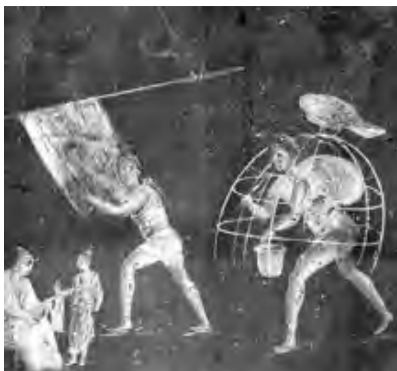
Figg. 14, 15 - Particolari dell'affresco della fullonica di Lucius Veranius Hypsaeus da Pompei