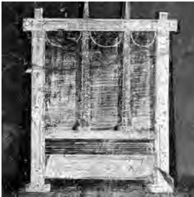
Fig. 16 - Particolare dell'affresco della fullonica di Lucius Veranius Hypsaeus da Pompei

Infine il fullone doveva procedere a un'ultima spazzolatura del panno (anche se questa operazione non è esplicitamente menzionata nelle fonti) prima che esso fosse sottoposto alla piegatura e alla pressatura. L'artiere incaricato di questo lavoro, lo stendeva con cura ( diducere tendiculis ), lo aspergeva leggermente con acqua spruzzandola direttamente dalla sua bocca quanto più uniformemente possibile e, in ultimo, lo estraeva dalla pressa ( solutis pressoriis ).