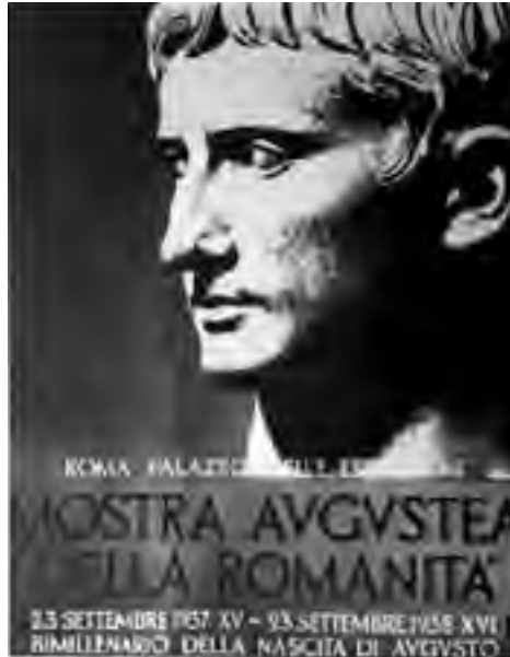
Fig. 10 - Manifesto della Mostra del 1938