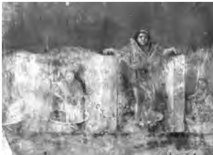
Fig. 13 - Particolare dell'affresco della fullonica di Lucius Veranius Hypsaeus da Pompei (fonte: http://cir.campania.beniculturali.it/museoarcheologico nazionale/ )

In questa prima fase l'acqua veniva miscelata a sostanze chimiche alcaline e depuranti (con il termine nitrum si comprendevano sia carbonato di potassio che carbonato di sodio); spesso veniva addizionata urina, sia umana che animale, perché più facilmente reperibile: l'approvvigionamento avveniva, secondo quanto tramandato dalle fonti, mediante grandi vasi di terracotta - testae - che venivano posizionati lungo la strada e prelevati una volta che erano stati riempiti. I fulloni, inoltre, ben conoscevano e sfruttavano le proprietà assorbenti dell'argilla smectita o creta fullonia che ancora oggi - per alcuni tipi di lavorazione - conserva un ruolo importante nelle operazioni di sgrassatura dei tessuti di lana rendendoli più morbidi e soffici. Gli antichi distinguevano diversi tipi di argilla: la più rinomata - e pregiata - era la creta cimolia (così denominata perché veniva estratta in una piccola isola delle Cicladi, Kimolos) e poteva essere bianca o colorata; a questo tipo vennero assimilate, in seguito, tutte le argille con la medesima composizione. In alternativa si faceva ricorso alla umbrica terra , al saxum o alla terra sarda (quest'ultima era utilizzata esclusivamente per il trattamento delle stoffe bianche). Lo scopo di questo trattamento era, quindi, di fare aderire le sostanze chimiche al panno, alle componenti grasse e alle impurità in esso contenute per eliminarle.