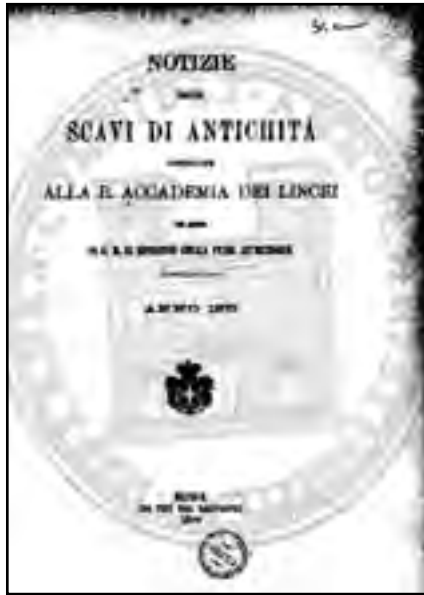
Fig. 2 - Frontespizio delle Notizie degli scavi di antichità , 1878

Egli si fa persuaso che «molti altri sepolcri esistono ancora nel terreno frugato, e moltissimi nell'adiacente inesplorato». Come sarà sua abitudine, Santarelli dà immediata comunicazione del rinvenimento alla comunità scientifica in un resoconto pubblicato in Notizie degli scavi di antichità comunicate alla regia Accademia dei Lincei nello stesso anno 1878, pp. 153-156.