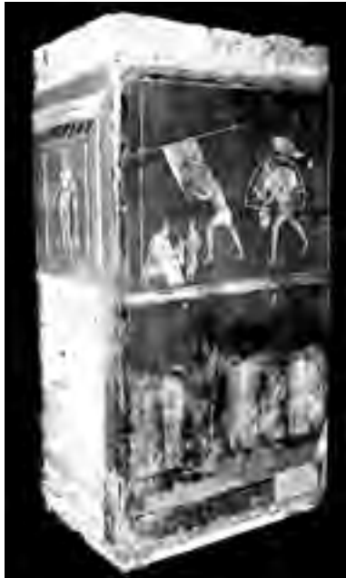
Fig. 8 - Affresco dalla fullonica di Lucius Veranius Hypsaeus di Pompei (Museo Archeologico Nazionale di Napoli)

L'interpretazione proposta risulta, pertanto, avvalorata dal rinvenimento, avvenuto alcuni decenni prima della scoperta al Melatello, dell'affresco della fullonica di Lucius Veranius Hypsaeus a Pompei (Regio VI, Insula 8, 20-21.2): l'affresco che riproduce scene delle diverse fasi della lavorazione dei panni all'interno dell'officina, è oggi conservato al Museo archeologico nazionale di Napoli (Inv. MANN 9774).