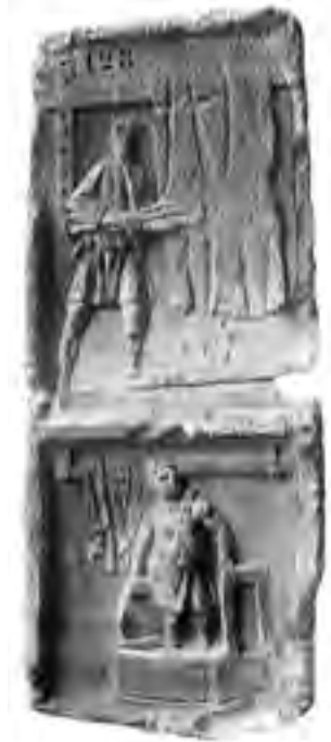
Fig. 9 - Rilievo del fullone conservato presso il Museo civico di Sens (da: ESPÉRANDIEU, Recueil général des bas-reliefs , cit., 1911, p. 12)

lavorazione dei tessuti all'interno di una fullonica : il bassorilievo è interpretato come lapide sepolcrale pertinente al monumento funerario di un fullone 40 .