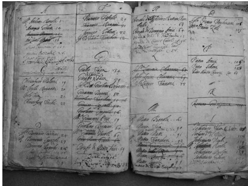
Indice generale (particolare)