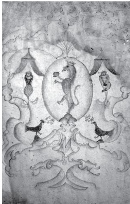
Pagina decorativa del cabreo Salaghi (ASCF, Ospedale civile , Cabreo)

9. «Inventario de' beni stabili, mobili, semoventi, crediti e passività lasciati dalla buona memoria reverendo sig. don Luigi Salaghi della città di Forlimpopoli, morto nella città di Forlì li 13 lug. 1832», 1832 lug. 21, Forlì, notaio Lorenzo Benedetti.