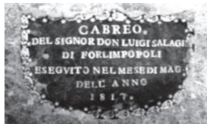
Copertina del cabreo Salaghi (ASCF, Ospedale civile , Cabreo)