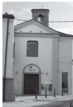
Evoluzione stilistica della facciata dal 1919 ad oggi.