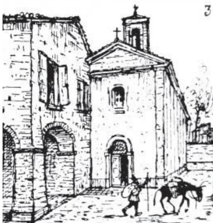
Sequenza grafica della presupposta evoluzione stilistica della chiesa di S. Nicolò (disegno di P. NOVAGA).