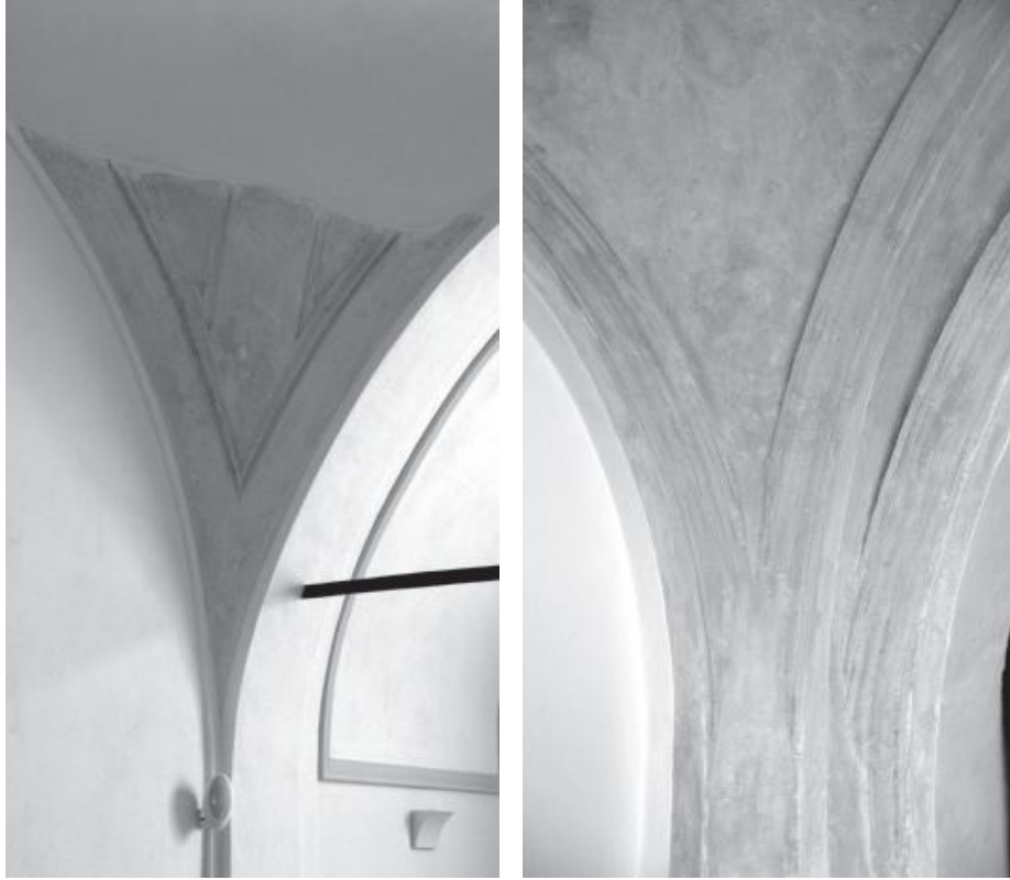
Resti della decorazione della cupola.