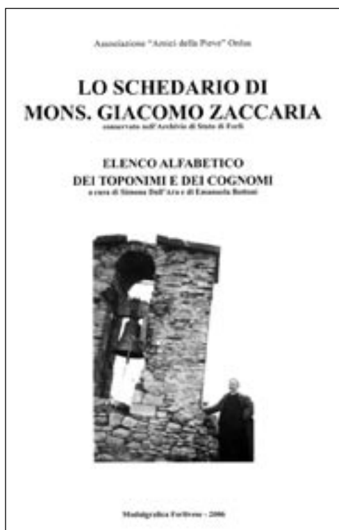
Copertina del volume contenente l'elenco dei toponimi e dei cognomi.

Si potrebbero fornire tanti altri esempi, ma mi fermo qui, rimandando alla consultazione del volume e all'interrogazione della banca dati, sia coloro che già hanno consultato lo Schedario nella sua versione cartacea, in modo da potenziare con lo strumento informatico la loro ricerca, sia coloro che dopo la lettura di questo contributo saranno incuriositi (lo spero) e vorranno utilizzare questi strumenti, rassicurandoli che la ricerca sarà decisamente meno noiosa di queste pagine.