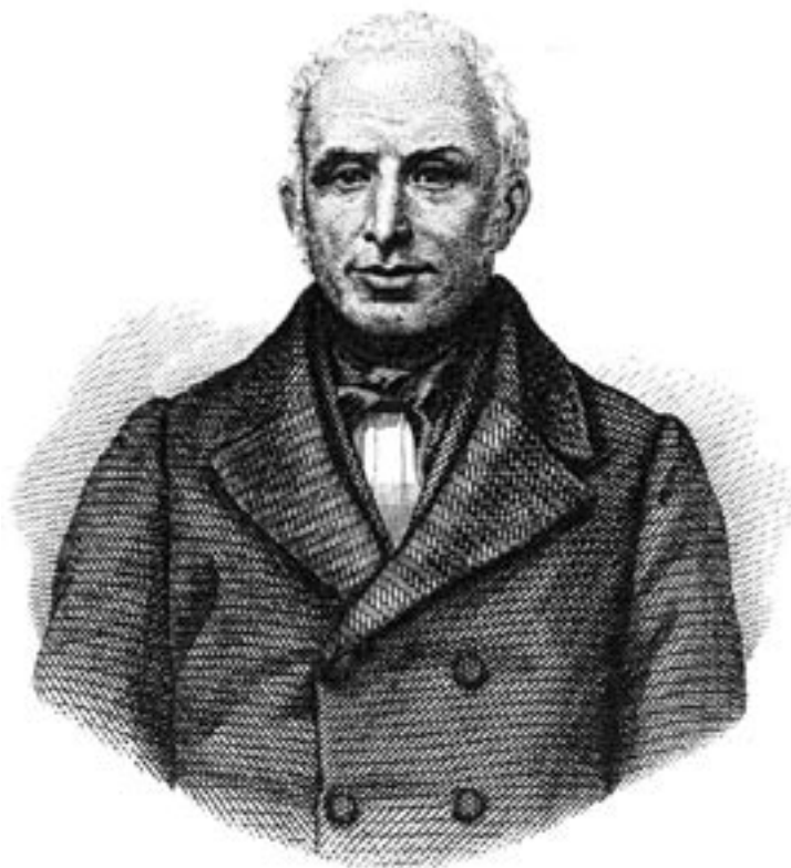
Fig. 2. Ritratto di Maurizio Bufalini, in P. MANTEGAZZA, Maurizio Bufalini , Torino, UTET, 1863.