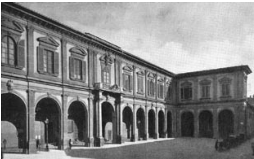
Arcispedale di Santa Maria Nuova di Firenze nella prima metà del Novecento