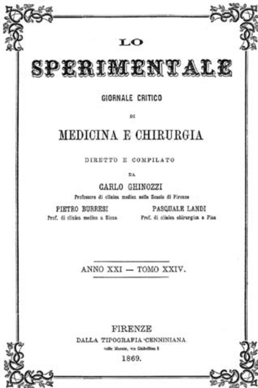
Fig. 3. Frontespizio del primo numero de Lo Sperimentale , diretto da Carlo Ghinozzi (1869).