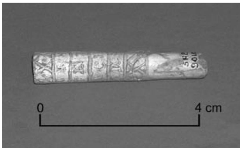
Fig. 2 – FORLIMPOPOLI, Museo "T. Aldini" . Bastoncello di osso (foto di E. Piolanti). Su concessione del Ministero per i Beni e le Attività Culturali. Soprintendenza per i Beni Archeologici dell'Emilia-Romagna.