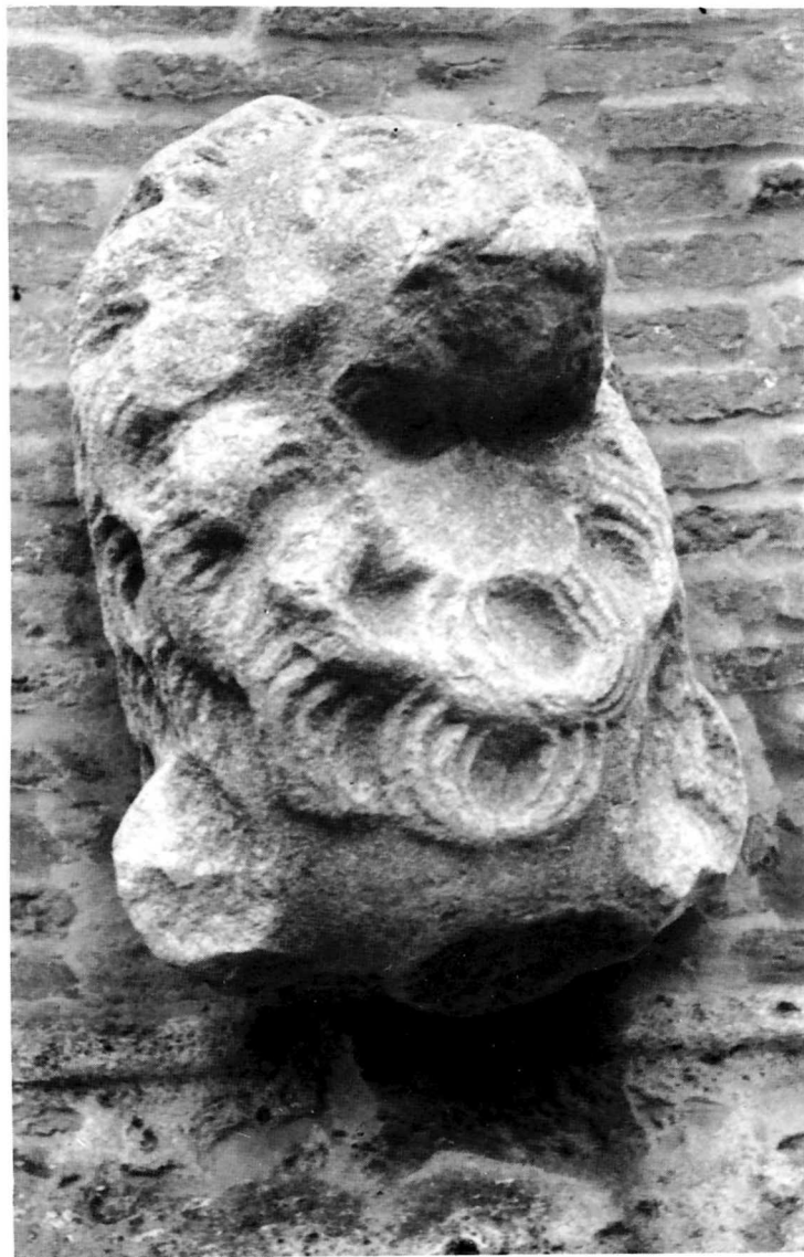
Fig. 1 - Forlimpopoli (Fo). Chiesa di S. Rufillo. Testa di leone murata nel campanile.