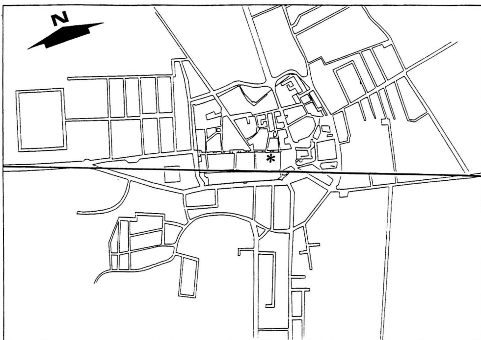
Fig. 5 - Pianta di Forlimpopoli con collocazione del lacerto entro il tessuto urbano. In neretto il percorso dell'antica via Emilia e a tratteggio quello dell'odierna via A. Saffi.