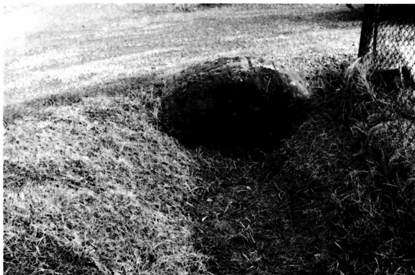
Casemurate , Via Macoda 2. Mola ruotante da guado, riutilizzata come vera da pozzo, ora come spalla di chiavicotto.

da guado “in loco detto Coriano” verso le colline a ridosso di Forlimpopoli (6). In un atto notarile del 30 -XII- 1457 è presente a Forlimpopoli un mercante di guado (7).