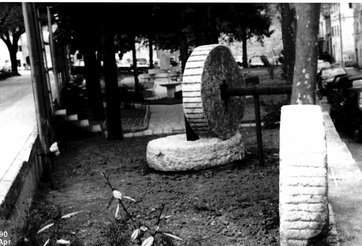
PIobbico. Un mulino da guado nei giardini pubblici.