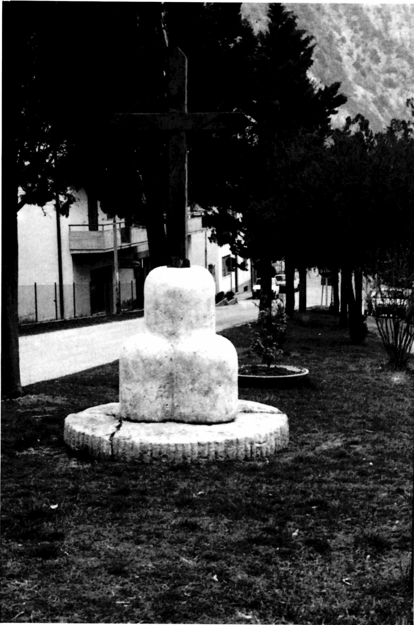
PIOBBICO ( Pesaro ). Mola da guado riutilizzata come base per una croce.