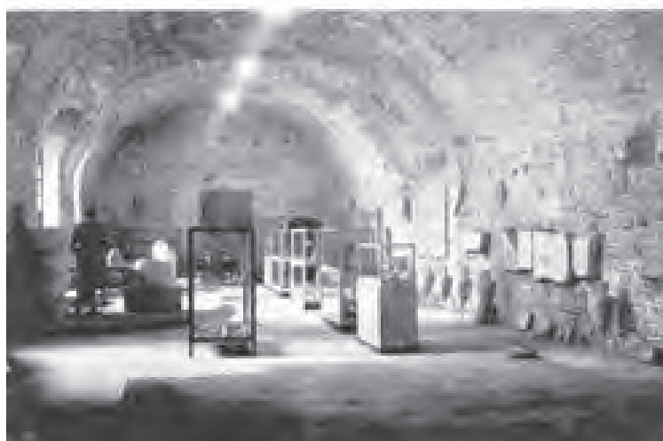
Frontespizio del pieghevole realizzato come guida del Museo Civico di Forlimpopoli nel 1974

A cura dell'Amministrazione Comunale di Forlimpopoli