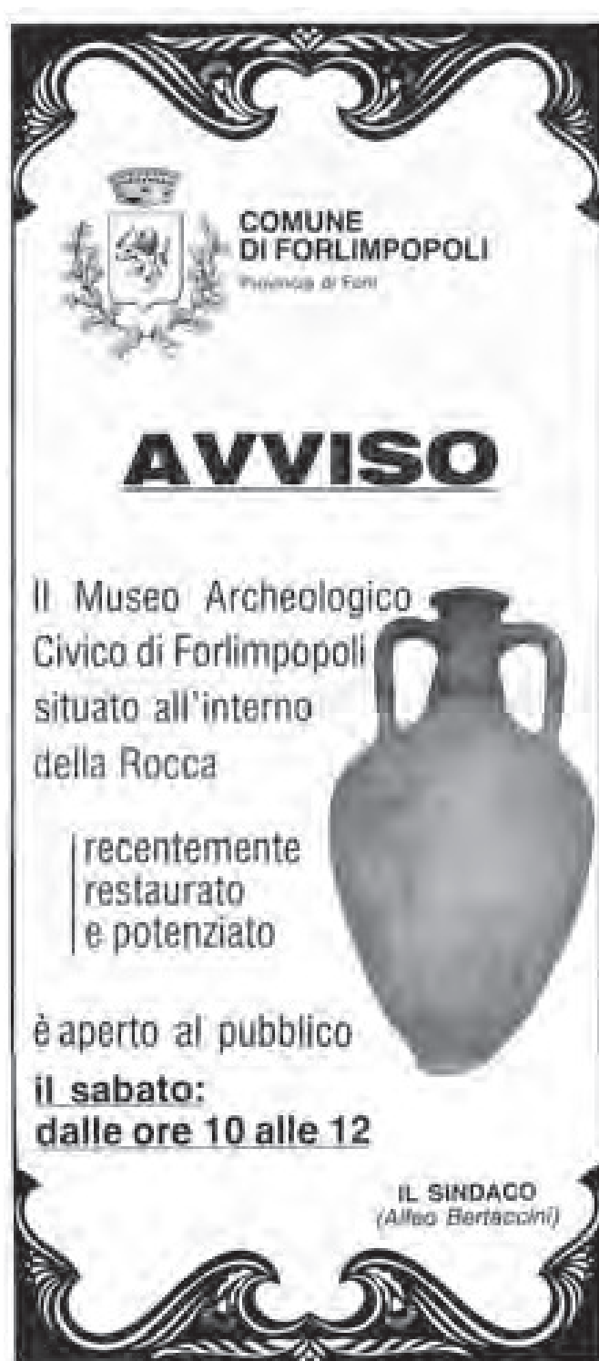
Manifesto-invito alla riapertura del Museo di Forlimpopoli dopo il restauro